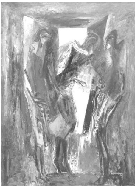
Енчо Пиронков – „Жени с риби“