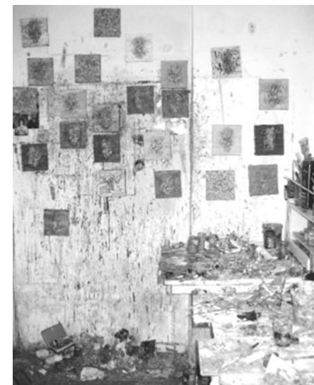
Людмил Лазаров – „Черепчета“

наименована „Черепчета“, представи галерия „Агрион“ от 14 април до 5 май.