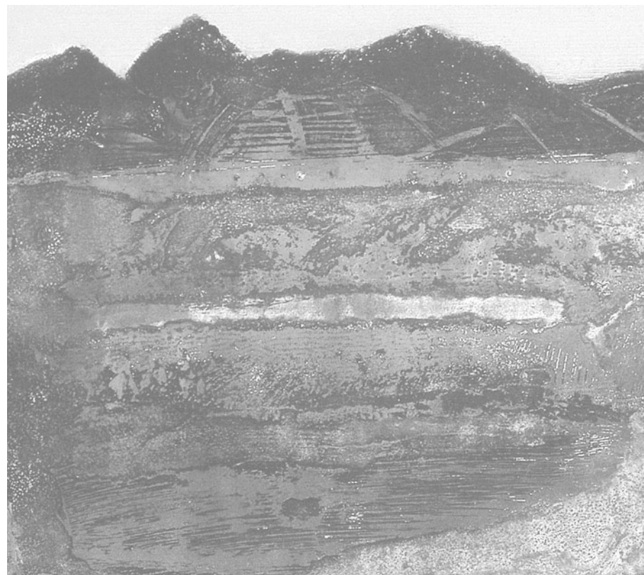
Тодор Панайотов – „Пейзаж“, детайл.