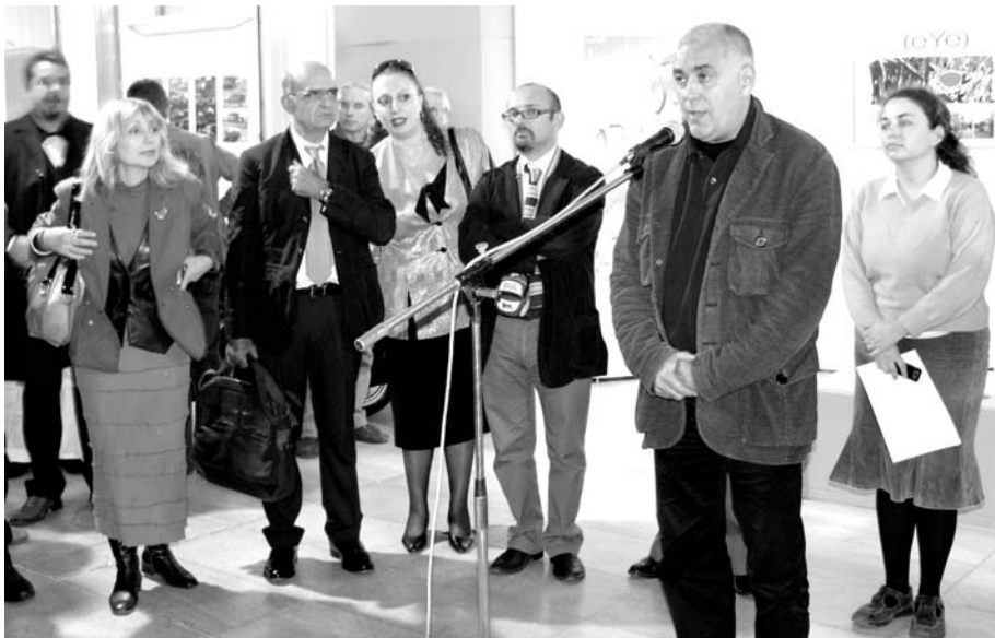
Откриване на биеналето

Често ми се случва да срещам опоненти на идеята, че може въобще да се говори за български дизайн – нямало такова понятие.