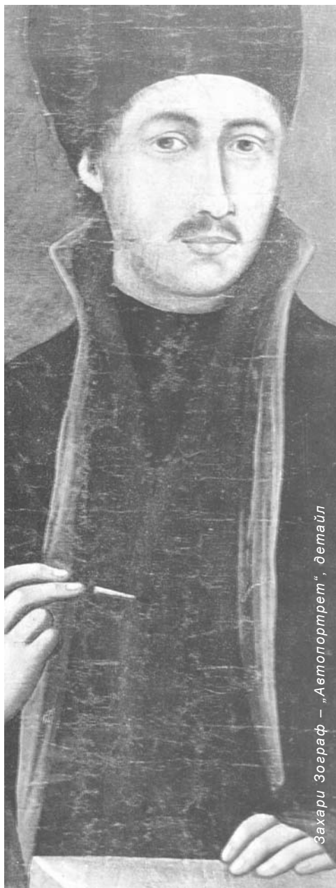
Зahari Зограф – „Автопортрет“, детайл