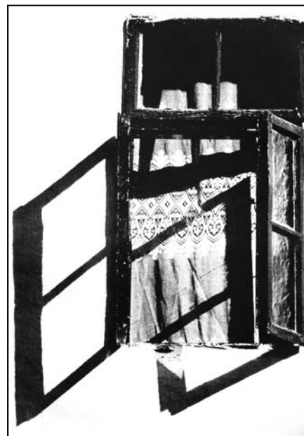
Бранко Николов - „Прозорец“

Годишна изложба на секция „Графика и илюстрация“ от 9 до 28 май 2008 г., етаж 3-ти, СБХ, „Шипка“ 6.