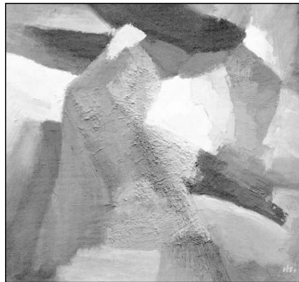
Йордан Петров – „акрил, платно, 60/55 см“