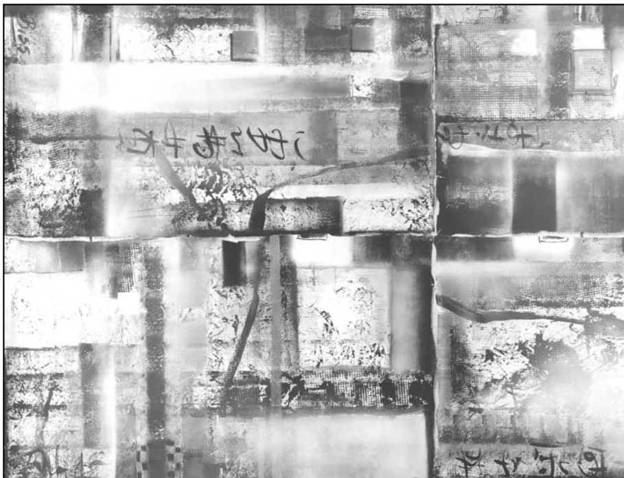
От изложбата, детайл

Художникът и културния контекст, в които съществува определят неговата визуална идентичност, неговото поле на действие, професионални качества, неговият интелект и политико-социална активност. Интернационалният обогатява идентичното с нови идеи, нови визуални стратегии, различни от традиционния културен фон.