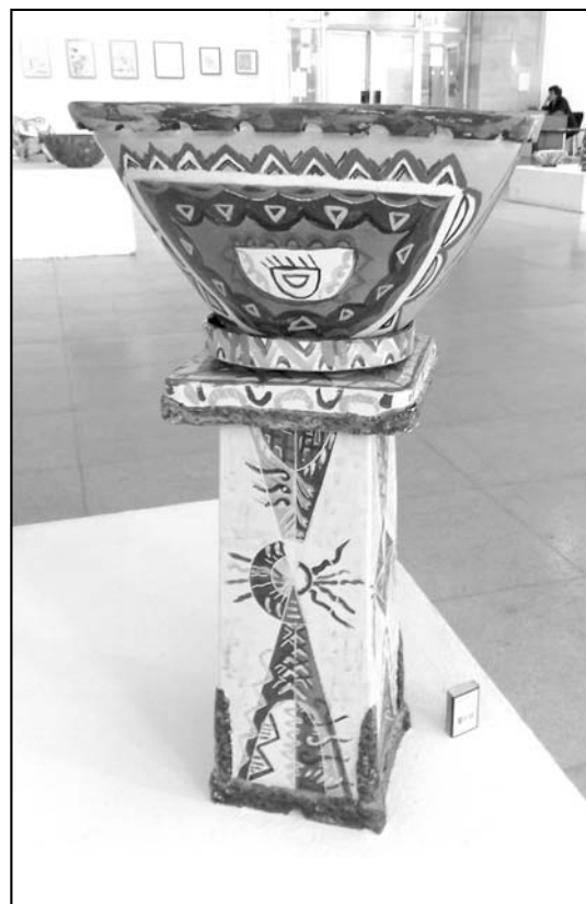
ИнфоСБХ, брой 6, 2008