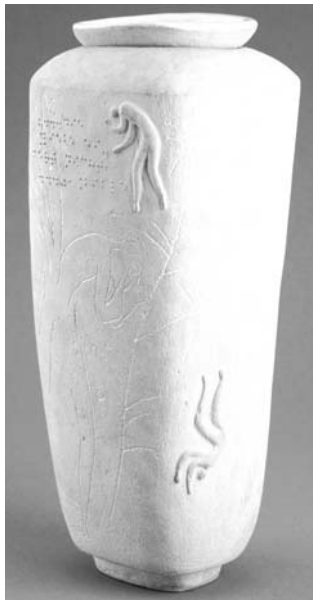
Ив. Иванов – „Свещникова ваза“

Авторът умело използва съчетанията между фактура,