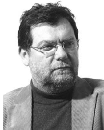
Ивайло Мирчев Председател на СБХ