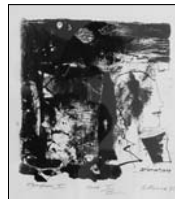
Валентин Колев „Профил 2“ 1995 литография