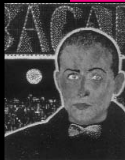
Антон Терзиев „Автопортрет„