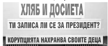
П. Панайотов – от изложбата на Секия 13

На 18 юли НХГ и Културен център „Двореца“ – Балчик откриха изложбата – Международен пленер „Двореца“ 2005-2006 – избрани творби. Изложбата се състоя в НХГ, София.