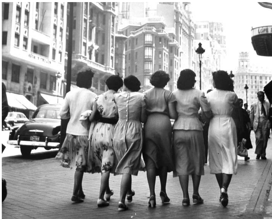
Картала Рока – „Госпожици на разходка“. От изложбата „150 год. фотография в Испания“

непоказвани творби на големия български художник проф. Найген Петков .