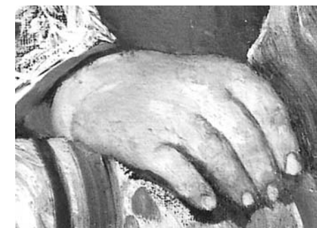
Реставрирана картина на Мърквичка от изложбата на секция „Реставрация“