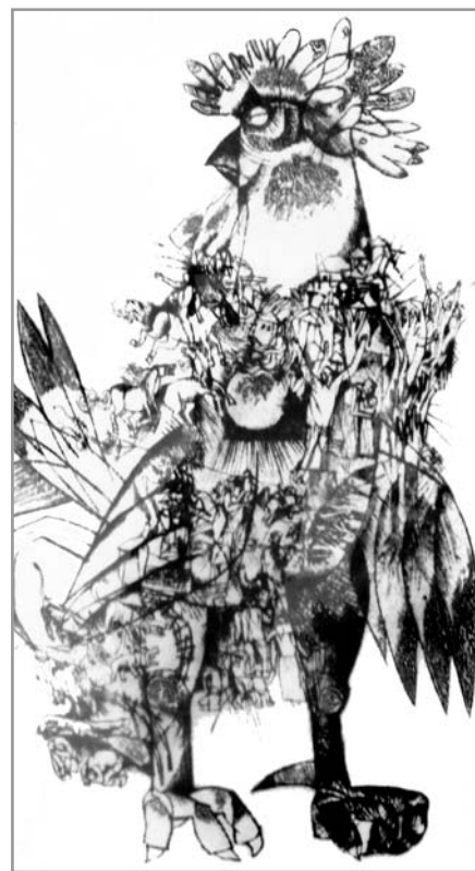
Румен Скорчев „Разсъмване“