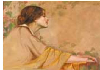
Васил Стефанов - Чилито, Портрет на тъгуващата, 1915 г.

През ноември 2012 г. Русенската градска галерия отбеляза 80-годишнината от нейното основаване. То е следствие от преминалата с голям успех първа обща изложба на група русенски художници през зимата на 1933 г. Днес фондът на галерията съдържа около 2800 творби на български и чуждестранни автори от края на XIX век до съвременността.