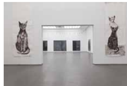
Из изложбата Axis mundi