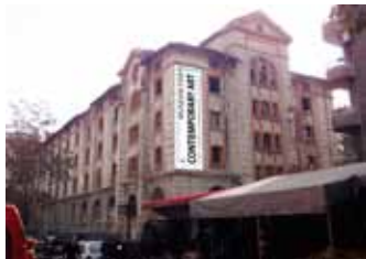
Музей на съвременното изкуство в старите тютюневи складове

Като част от инициативата „Пловдив - кандидат за европейска столица на културата 2019“ Центърът за съвременно изкуство-Пловдив и Градската художествена галерия реализираха проекта URBAN DREAMS / Градски мечти. В рамките на проекта от 22 ноември 2012 г. художникът Емил Миразчиев иницира символично откриване на културни центрове в града. Рушащи се забележителни сгради влязоха в образа на музеи на съвременното изкуство, на фотографията, център за нови медии и още. Акциите на автора насочват погледа към преосмисляне на бъдещето на старите сгради и остро усещаната се в града липса на пространства за култура.