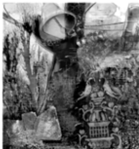
Александър Сертев, Древно дърво II

Поредичата изложби на Александър Сертев през юбилейната за художника 2012 година завърши с обширна експозиция в галерията на СБХ, зала „Райко Алексиев“. Художникът представи свои творби от всички области, формиращи неговия творчески портрет - планат, графичен дизайн, графика и фотография.