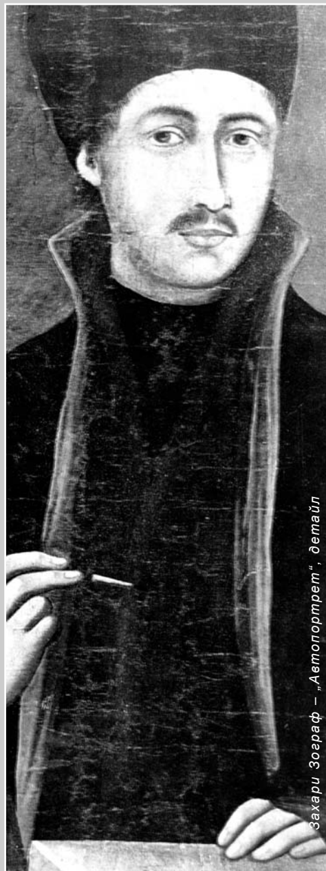
Захари Зограф – „Автопортрет“, детайл