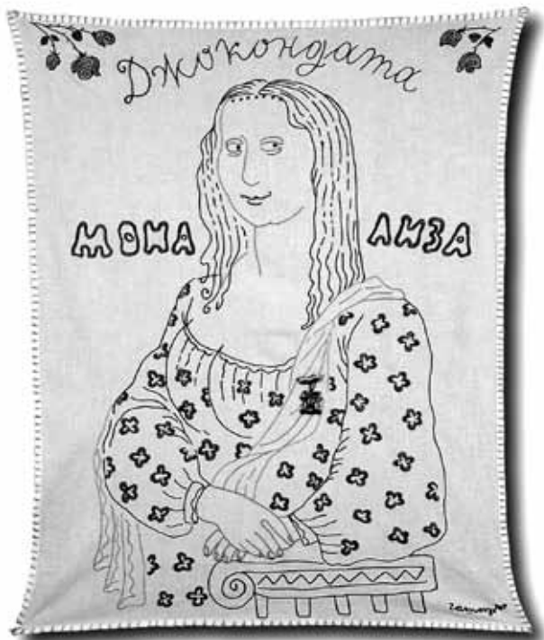
Румен Гашаров - Джонкондата