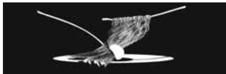
Камен Старчев - Мистерия с парцал (детайл)

Изложбата не търси всеобхватен преглед в тази посока, а е един субективен подбор на автори и произведения.