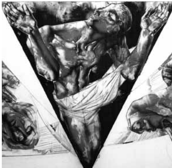
Любомир Каралеев - Композиция 1

Неслучайно и наградите на биеналето са присъдени от авторитетно жури съответно на Галина Цветкова /награда на Община Велико Търново/, Любомир Каралеев /награда на СБХ/ и Пламен Братанов /награда на ВТУ/.