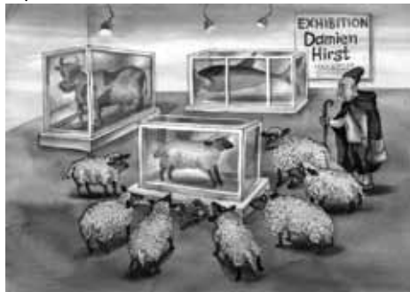
Карикатура от международната изложба