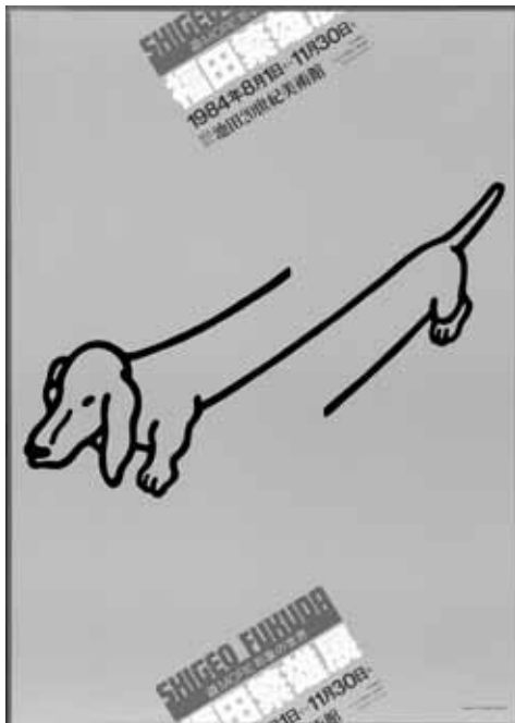
Шигео Фукуда - плакат

Фондацията за културно развитие DNP искрено се надява, че настоящата изложба на японски плакати ще допринесе за по-нататъшното задълбочаване на културните връзки между България и Япония.