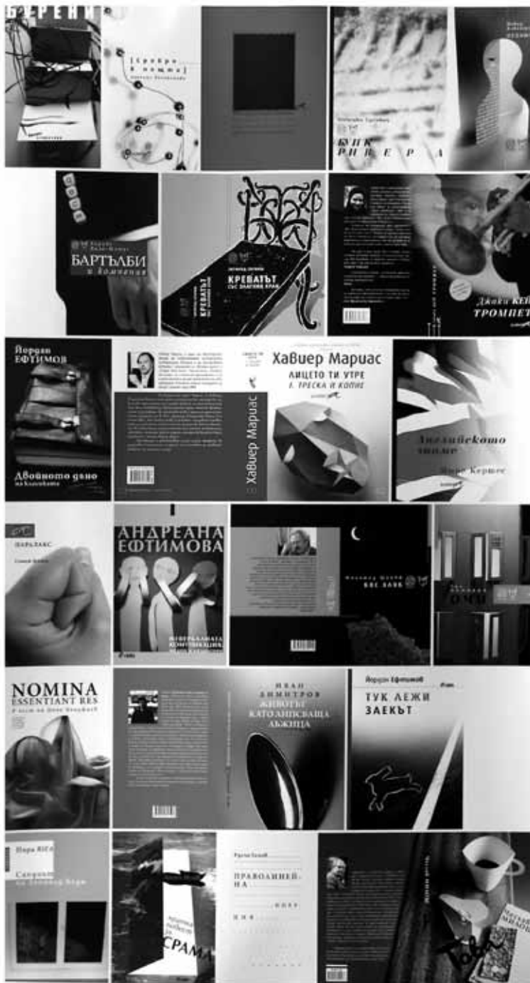
Капка Кънева – Обложки на книги