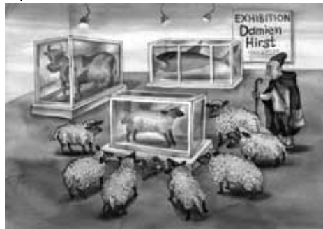
Карикатура от международната изложба