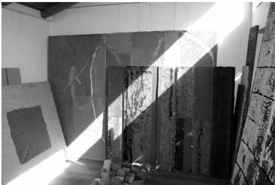
Свилен Блажев - от ателието