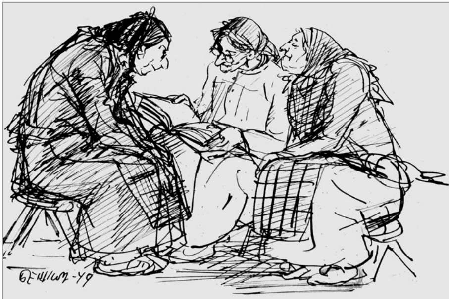
Бешков – „Баби четат“, 1949 год.

„...Истинското изкуство е да нарисуваш това, в което вярваш!“ Илия Бешков