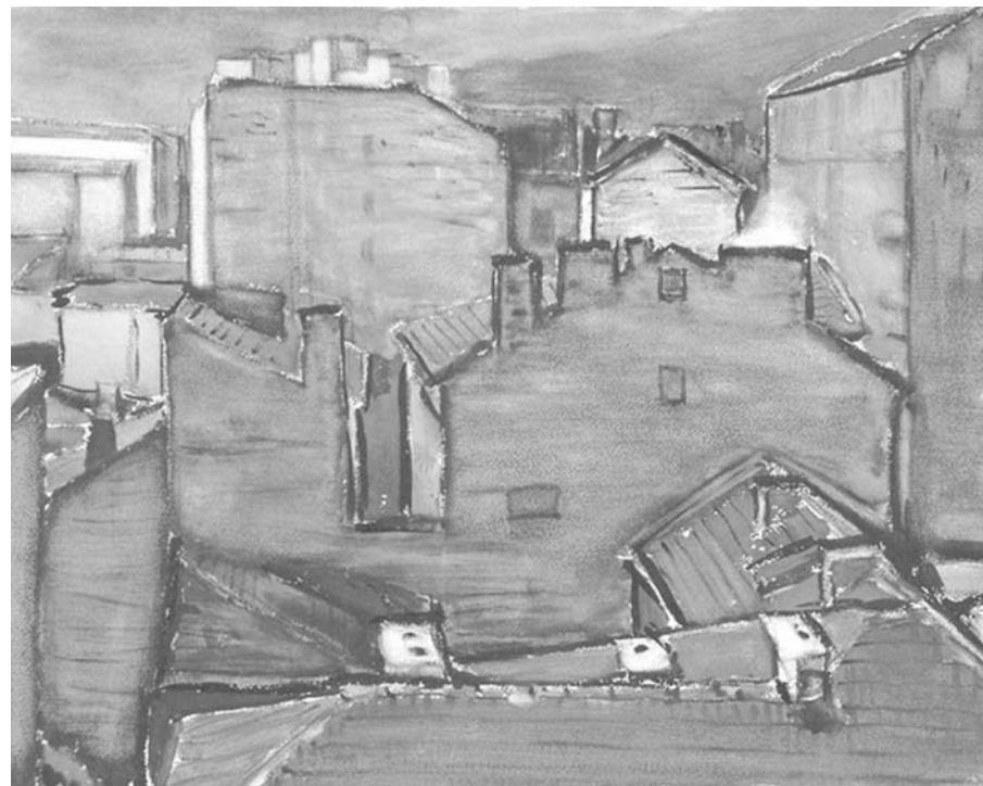
Петър Младенов - „Пейзаж“