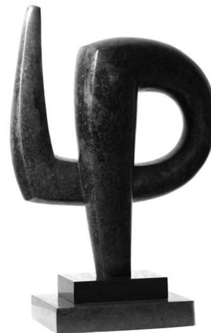
Богомил Живков – „Знак“

В лимитираното пространство на скулптурата също съжителстват доста разнообразни в пластическо, тематично и концептуално отношение произведения. Голяма част от авторите са особено последователни в предпочитанията си към „отключване“ на изразния потенциал на материала, свободно експлоатиран в овеществяването на идеята. Периметърът, върху който се извършват подобни експерименти обхваща, както фигуративни и абстрактни, така и по-скромно представените в изложбата концептуални решения. С репликирането на христоматийни етапи от развитието на модерното изкуство се срещаме в пластиките на Ив. Аврамов („Фигура“ I-III), Г. Жеков („Посвещение на Джакомети“), Ст. Влагов, Н. Диков, където ирационалното развитие на връзките и ажурната лекота на вибриращите силуети ни връщат към парадоксите на сюрреализма. В абстрактните пластики на Цв. Христов („Ин и Ян“), Ив. Чолаков („Пробуждане“), Ч. Велев („Процес“), Т. Цанова, присъства първично, универсално чувство за сила на формата, изразено в статичното напрежение на камъка или в оголената арматура на