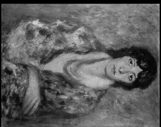
Живко Чолаков „Портрет на млада жена.“