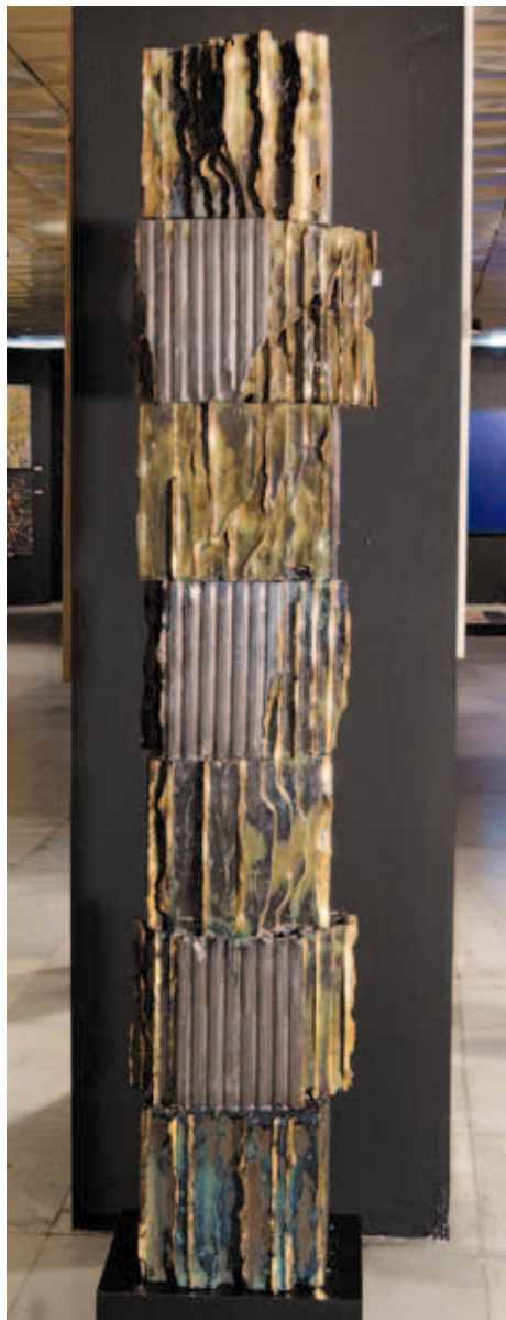
Георги Георгиев - Колона от изложбата „Салон 2011“