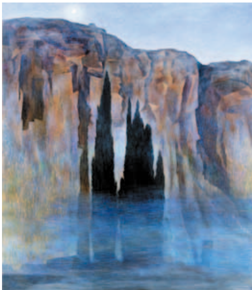
Петя Денева - от изложбата „Салон 2011“ (награда на СБХ)

Журирането се осъществява от СБХ и представител на Посолството на Кралство Норвегия.