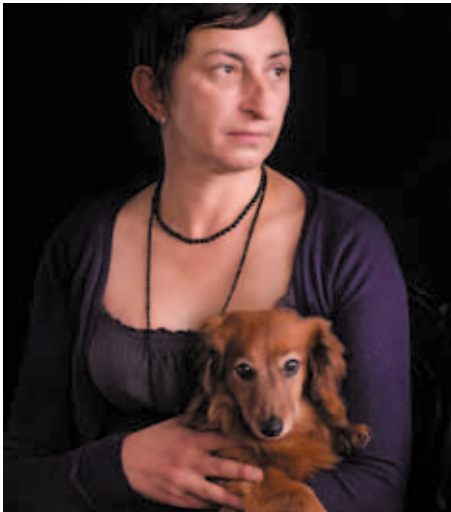
Александър Вълчев – Е. П. – художник (Дамата с дакела)

(ДАКЕЛЪТ В СЪВРЕМЕННОТО БЪЛГАРСКО ИЗОБРАЗИТЕЛНО ИЗКУСТВО)