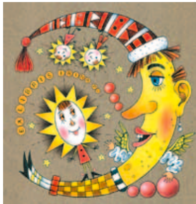
Майя Чолакова - Екслибрис

В заключение ще отбележа, че характерът на изкуството на Майя Чолакова като че ли най-точно може да бъде описан чрез една от една от любимите ѝ латински сентенции, която гласи ne quid nimis , или иначе казано – нищо излишно.