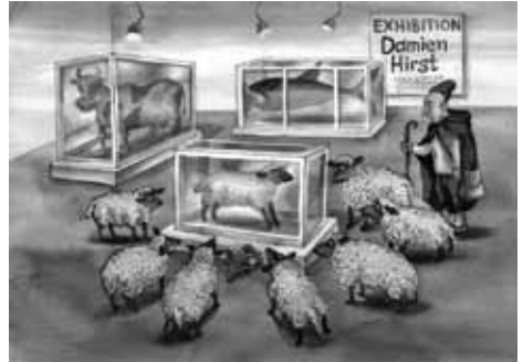
Карикатура от международната изложба