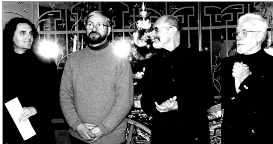
Откриване на изложбата

Далеч съм от мисълта да ви въвличам в патоса на едни буквални сравнения, които биха звучали нелепо, а просто разчитайки на вашата интелигентност, без да искам да подце-