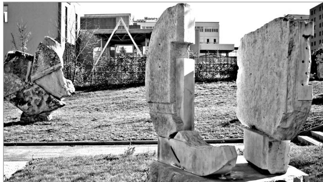
Част от пластиките, ситуирани в парк „Свети Николай Чудотворец“