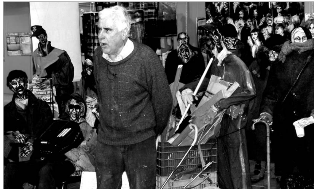
Част от изложбата