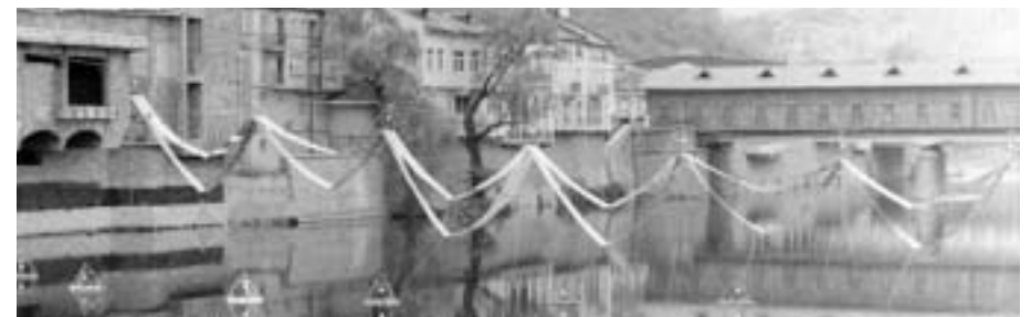
„Мостове на изкуствата“ – Група ДЕ